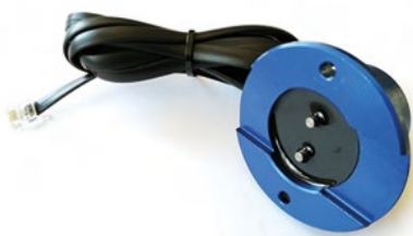
DN-S-W Czujnik rejestrowania obecności wody