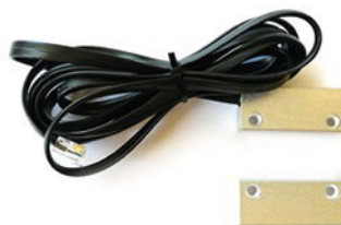
DN-S-D Czujnik otwarcia/zamknięcia drzwi