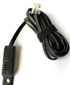
DN-S-T/H Czujnik temperatury/wilgotności