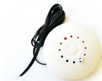
DN-S-S Czujnik rejestrowania obecności dymu